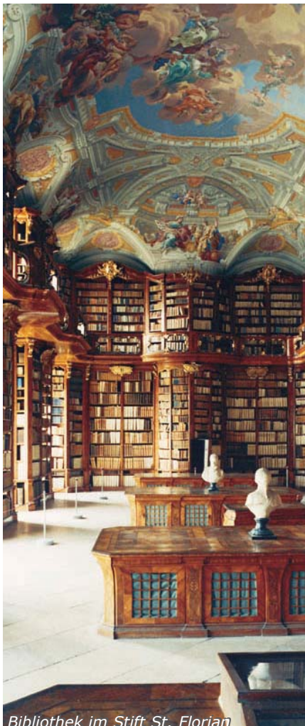
Bibliothek im Stift St. Florian

Dabei sollten ähnliche Projekte wie jenes mit Italien für Ungarn, die Slowakei und Slowenien realisiert werden. Es hat bereits Vorgespräche mit Schloß Gödölö und Schloß Konopischt gegeben. Noch innerhalb dieses Kalenderjahres sollen die Gespräche zum Abschluß gebracht und konkrete Ergebnisse vorgelegt werden. Der Gedanke,