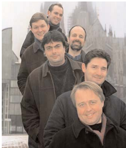
Die King's Singers auf der Suche nach musiktheatralischen A-cappella-Werken

Rudolf Buchbinder gestaltet am 23. Juli einen speziellen Kammermusikabend, Starflötist James Galway gibt am 13. August mit den London Mozart Players ein Konzert im Theater an der Wien.