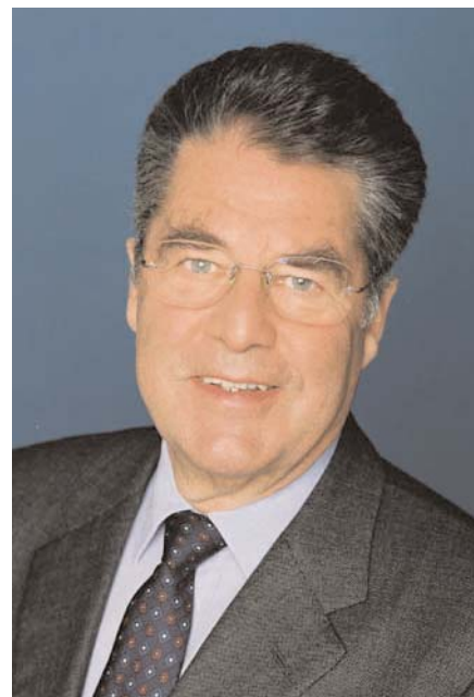
Der Zweite Nationalratspräsident, Dr. Heinz Fischer