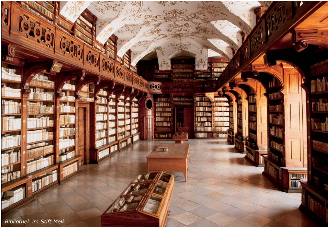
Bibliothek im Stift Melk