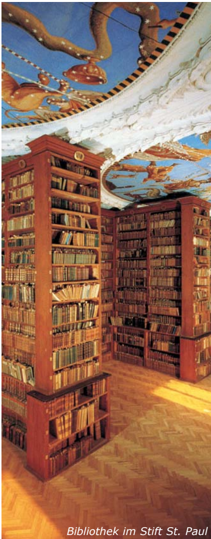
Bibliothek im Stift St. Paul