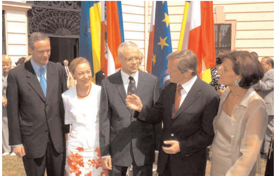
Im Bild (v.l.n.r.): Tschechiens Außenminister Dr. Cyril Svoboda, Österreichs Außenministerin Dr. Benita Ferrero-Waldner, Premierminister Dr. Vladimir Spidla, Bundeskanzler Dr. Wolfgang Schüssel und die niederösterreichische Landesrätin Johanna Mikl-Leitner

Gleichzeitig erinnerte der Bundeskanzler an die moralische Verantwortung Österreichs im Zusammenhang mit den Ereignissen des II. Weltkriegs. Schüssel: „Österreich