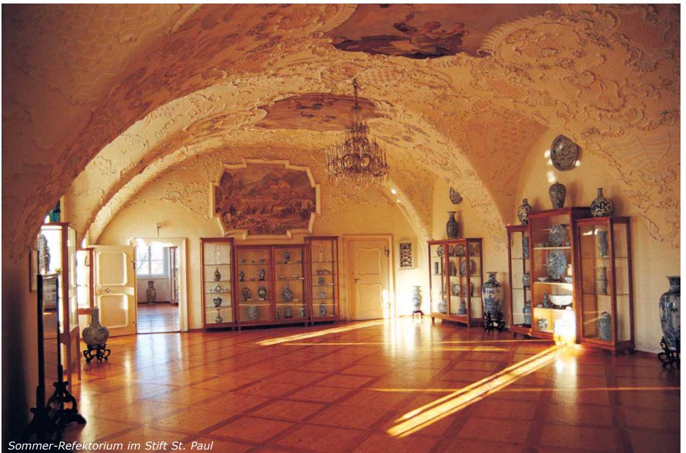
Sommer-Refektorium im Stift St. Paul