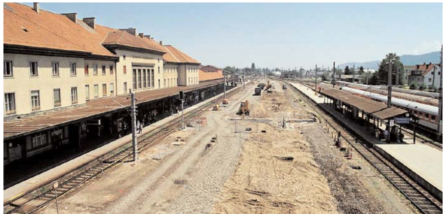
Gewaltige Veränderungen am Hauptbahnhof Klagenfurt zeichnen sich schon wenige Tage nach dem Spatenstich ab

Die Bautätigkeiten umfassen die Generalsanierung des Aufnahmegebäudes mit gestalterischen Verbesserungen im Inneren, die behindertengerechte Erschließung der Bahnsteige, die Schaffung von mehr Komfort im Kundenbereich, zeitgemäße Aufstiegshilfen sowie die Errichtung von optimalen Leit- und Informationssystemen zur Führung der Hauptverkehrsströme. Daneben erhält die Bahnhofsfassade einen neuen Anstrich und stadtsseitige Vordächer, außerdem soll die Errichtung von Lärmschutzwänden im Bereich des Bahnhofes erfolgen. ■