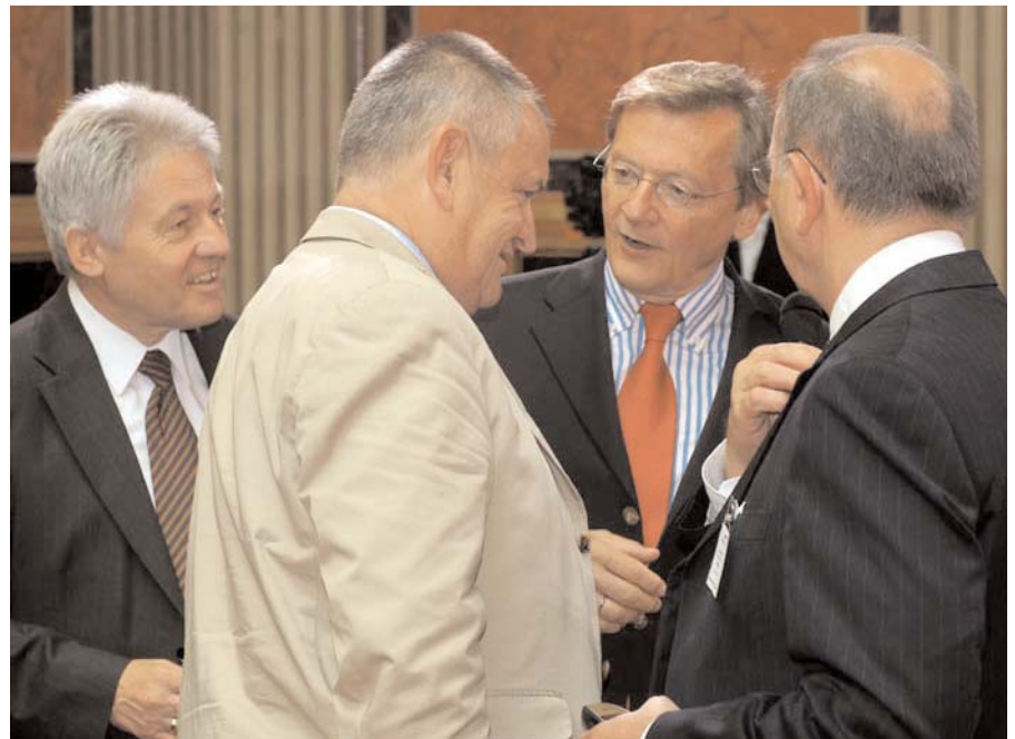
Im Bild (v.l.n.r.): OÖ Landeshauptmann Dr. Josef Pühringer, Vizekanzler und Sozialminister Mag. Herbert Haupt, Bundeskanzler Dr. Wolfgang Schüssel und Justizminister Dr. Dieter Böhmendorfer

In diesem Zusammenhang unterstrich sie, daß man trotz Neuordnung die Verfassung in ihren Grundfesten belassen müsse, und nannte dabei insbesondere das bundesstaatliche Prinzip. Dieses habe sich als ein gutes und notwendiges Fundament erwiesen, das Österreich erfolgreich gemacht habe. Wenn man daher am bundesstaatlichen Prinzip festhalte, heiße das nicht, dass man an Besitzständen festhalten wolle, vielmehr sei es Aufgabe, Synergien zu nutzen, zu motivieren, zu koordinieren, intelligente Projekte anzugehen und die Zivilgesellschaft hereinzubringen. Man brauche klare und nachvollziehbare Strukturen, die auch das Verständnis der BürgerInnen fänden, sowie eine korrekte und ordentliche Finanzgebarung, die es den Gemeinden und Ländern ermögliche, das zu tun, was den BürgerInnen nütze.