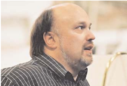
Regisseur Keith Warner folgt Sigmund Freuds Verständnis des Paares Macbeth / Lady Macbeth

Das Festival wird am 15. Juli mit Ernest Blochs 1910 uraufgeführter Oper Macbeth eröffnet. Regisseur Keith Warner folgt Sigmund Freuds Verständnis des Paars Macbeth / Lady Macbeth als sozusagen zwei verschiedene Seiten einer einzigen Figur. In seiner Regie will Warner vor allem das zeigen, was hinter dem Streben nach Macht steht, die Wurzeln des Bösen ausloten und auch zeigen, wie durch Manipulation und Medien Gut und Böse definiert werden. Das Publikum darf eine spannende Personenführung und ein äußerst wandelbares, das Düstere des Stücks voll zur Geltung bringendes Bühnenbild erwarten.