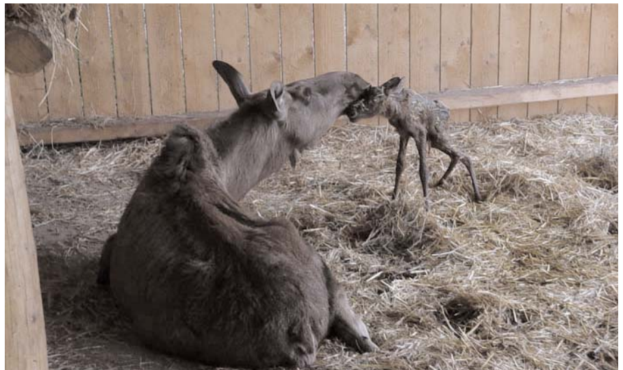
Reizender Elchnachwuchs wartet auf Ihren Besuch