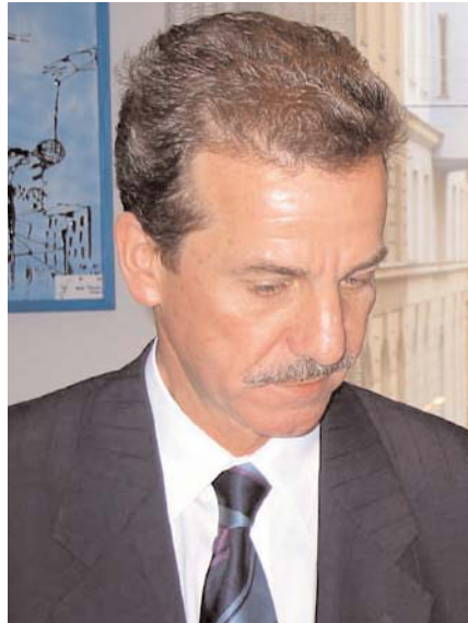
Rechnungshof- und Konvents-Präsident Dr. Franz Fiedler

dazu beigetragen haben, unsere Verfassung als geschlossenes System unserer staatlichen Grundlagen zu begreifen. Unübersichtlichkeit sowie Belastungen mit verfahrensrechtlichen sowie organisatorischen Regelungen kennzeichnen laut Fiedler unsere heutige Konstitution, „ganz zu schweigen von den vom Bundes-Verfassungsgesetz getrennt erlassenen Verfassungsgesetzen bzw. in einfachen Gesetzen enthaltenen Verfassungsbestimmungen, die in ihrer Gesamtheit dem