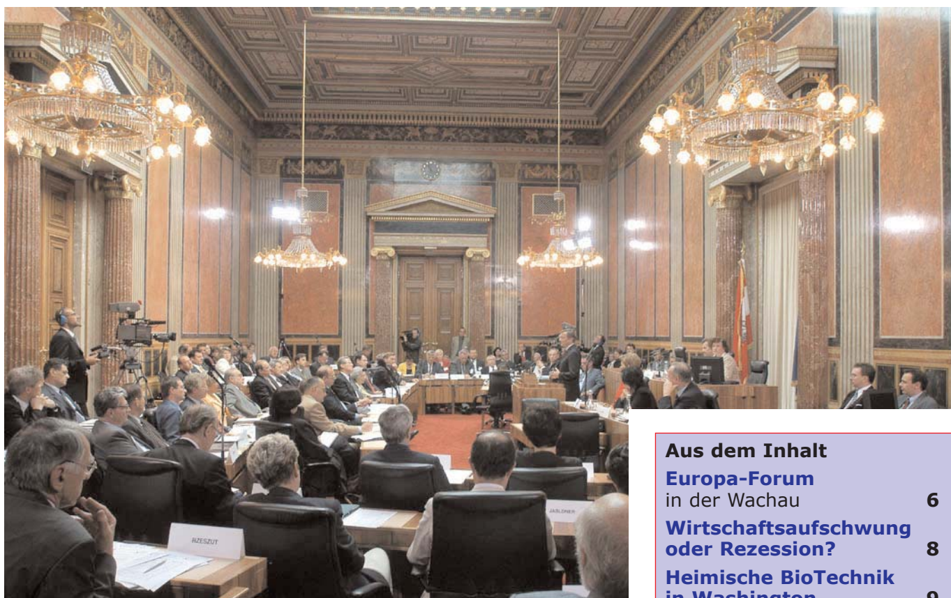
Am Montag, den 30. Juni 2003, traten die Mitglieder des Österreich-Konvents zur konstituierenden Sitzung im Bundesratssaal im Parlament zusammen. Im Bild Bundeskanzler Wolfgang Schüssel bei seinem Eröffnungsstatement.

Am Montag (30. Juni) Vormittag traten im Sitzungssaal des Bundesrates die 70 Mitglieder des »Österreich-Konvents« zu ihrer konstituierenden Sitzung zusammen.