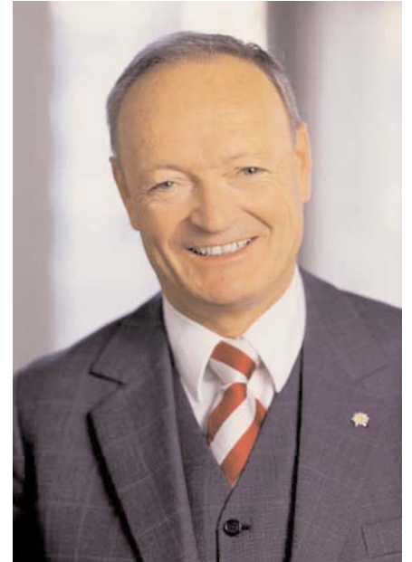
Nationalratspräsident Univ.-Prof. Dr. Andreas Khol

her auch beibehalten werden, betonte er. Für die Bürger sei es jedoch unzumutbar, die Grundrechte nicht in einer lesbaren Form vor sich zu haben, vielmehr brauche man in Österreich bereits eine Vorlesung, um die Rechte des Einzelnen zu eruieren. Dies sei nur ein Beispiel, warum man das Bewährte in der Verfassung in eine neue, zeitgemäße, verständliche und kurze Form bringen müsse. Die BürgerInnen sollen eine Verfassung in der Hand haben, wo sie ihre Rechte