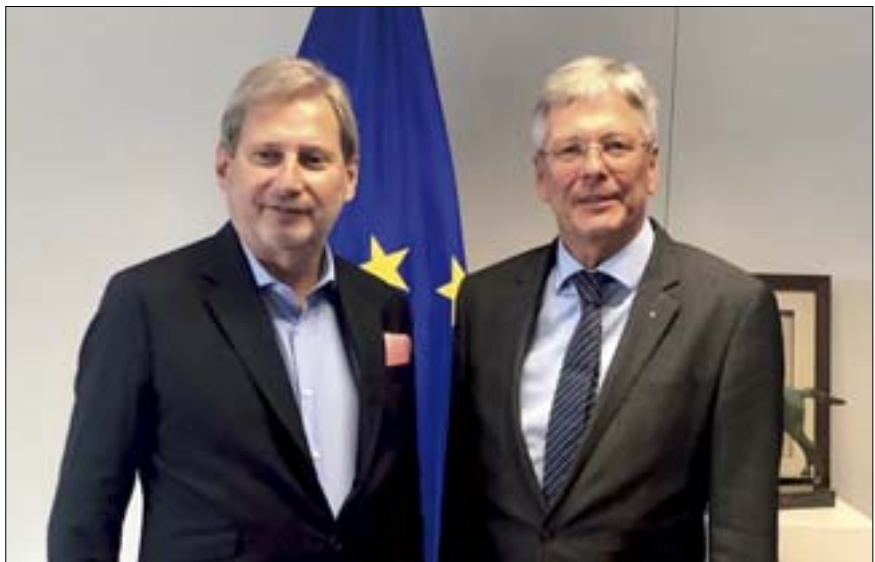
... und bei seinem Gespräch mit Österreichs EU-Kommissar Johannes Hahn in Brüssel

Landeshauptmann Kaiser als eine der Vorzeigeregionen in Bezug auf europäische Politik, die auch durch positive Finanzgebarung ihren Beitrag zu Stabilität leistet.