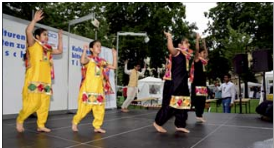
Die farbenprächtigen Tänzerinnen von „Indra Association Austria“ begeisterten die Zuseher.