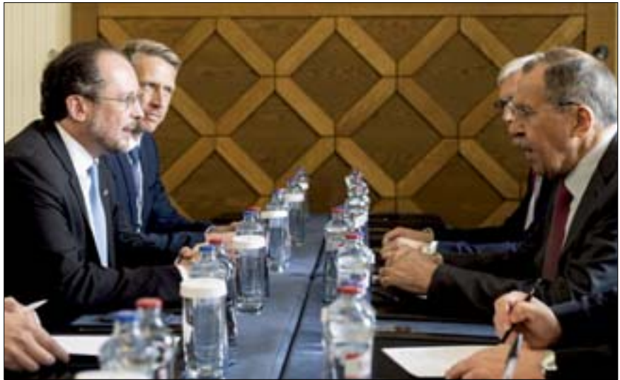
Außenminister Schallenberg (l.) mit seinem russischen Amtskollegen Sergej Lawrow...