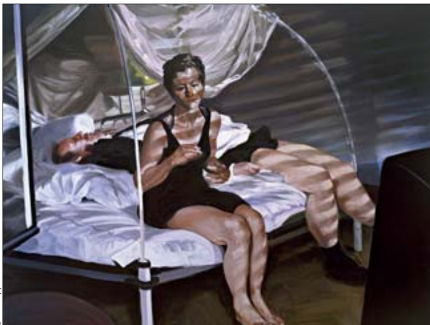
Eric Fischl, The Krefeld Project: The Bedroom. Scene 1, 2002

Ausstellung im Oberösterreichischen Landesmuseum zeigt mit Andy Warhol nicht nur echte Ikonen der Pop-Kultur, sondern verdeutlicht vor allem auch, wie präsent die amerikanische Bildkultur seit den 1960ern auch in Europa ist.“