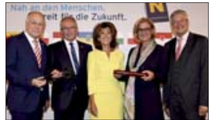
Niederösterreich übernimmt LH-Vorsitz