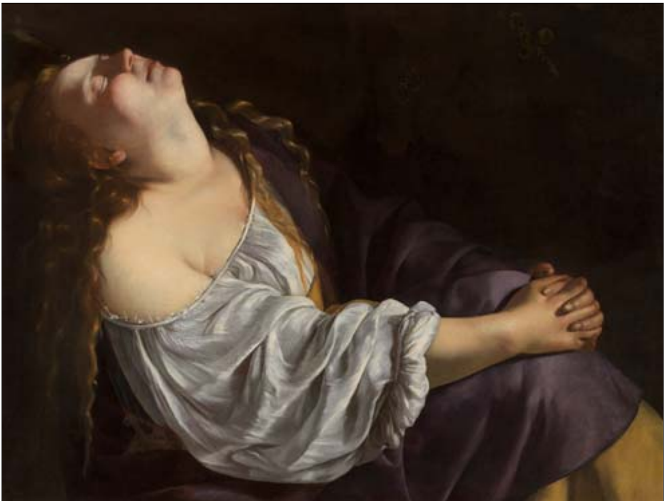
Bild unten: Artemisia Gentileschi (1593 Rom – um 1653 Neapel), Maria Magdalena, um 1613, Leinwand, Privatsammlung

Kunst auch für den österreichischen Barock prägend werden sollte, waren hierzulande bisher ebenfalls kaum zu sehen. Die Ausstellung spürt dem Phänomen des aufblühenden Barockzeitalters nach und stellt die revolutionäre Kunst im Rom dieser Zeit vor. Der Maler Caravaggio und der Bildhauer Bernini waren dabei die führenden Persönlichkeiten, die mit ihrer neuartigen Ausdrucksweise ebenso wie mit ihrem unkonventionellen Lebensstil in Rom für Furore sorgten.