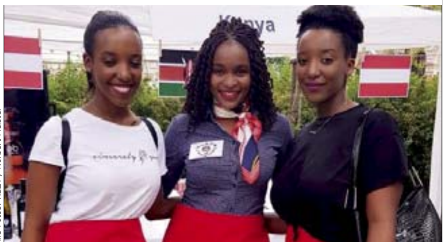
Zum ersten Mal unter dem Schirm von PaN nahm die Österreichisch-Kenianische Freundschaftsgesellschaft am Fest der Nationen teil – diese drei jungen Damen betreuen die Stände.