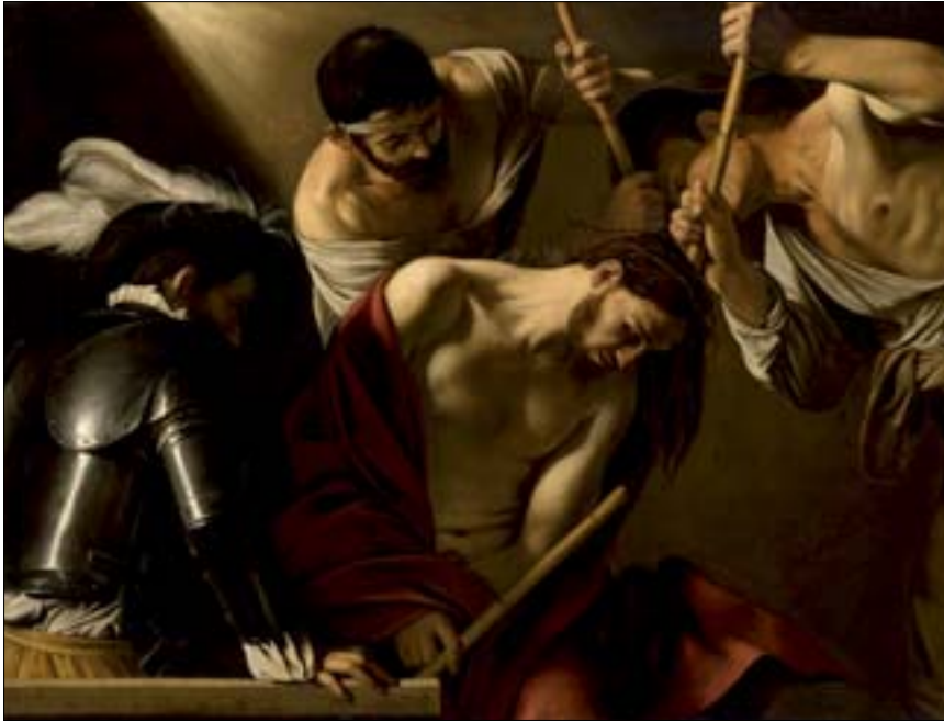
Bild oben: Michelangelo Merisi, gen. Caravaggio, Dornenkrönung Christi, um 1601, Leinwand, 127 × 166,5 cm Kunsthistorisches Museum Wien, Gemäldegalerie