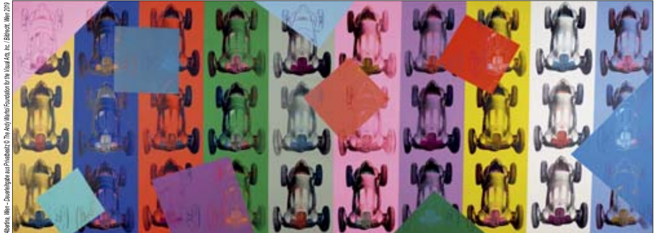
Andy Warhol, Mercedes-Benz Formel Rennwagen W125, 1987

Warhol bis Rauschenberg: Amerikanische Kunst aus der Albertina – von 19. November 2019 bis 29. März 2020 im Schlossmuseum Linz