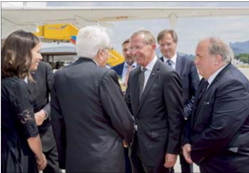
Sergio Mattarella wird von Salzburgs Landeshauptmann Wilfried Haslauer begrüßt.