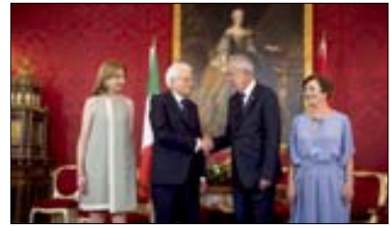
Staatsbesuch aus Italien