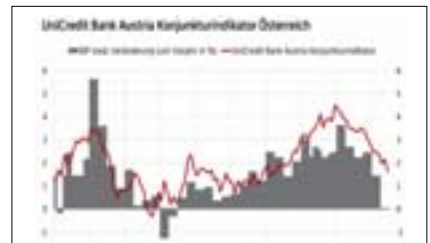
Österreichs Wachstum gebremst