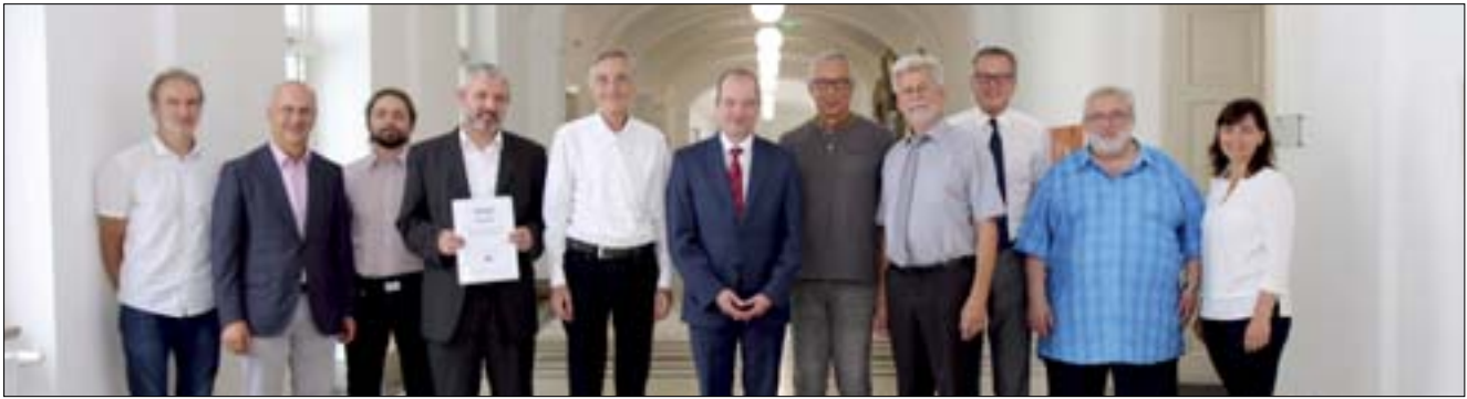
In Innsbruck fand die Gründungsversammlung für die neue europäische Genossenschaft READ COOP SCE mit Vertretern des Raiffeisenverbands Österreich, der Raiffeisen-Landesbank Tirol, der Transferstelle Wissenschaft-Wirtschaft-Gesellschaft und den Betriebsräten für das allgemeine und wissenschaftliche Personal statt.