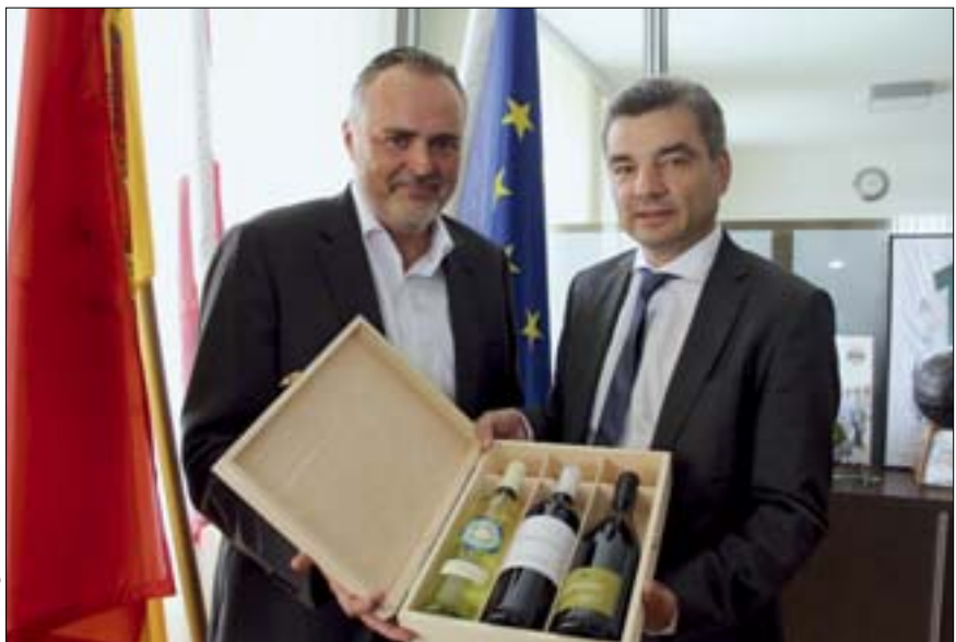
Landeshauptmann Hans Peter Doskozil und Innenminister Wolfgang Peschorn

Wolfgang Peschorn wurde 1965 in Wien geboren. Nach der Matura am Realgymnasium in Wien und der anschließenden Absolvierung des Grundwehrdienstes begann er im Oktober 1984 mit dem Studium der Rechtswissenschaften an der Universität Wien, das er 1988 abschloß. Im Jahr 1991 trat er in den Anwaltsdienst der Finanzprokuratorat ein und legte 1995 die Rechtsanwaltsprüfung sowie 1997 die Prokuratorprüfung erfolgreich ab. Seit Mai 2006 leitet er die Finanzprokuratorat, der die anwaltliche Vertretung und Beratung der Republik Österreich und jener Rechtsträger obliegt, die im Finanzprokuratoratgesetz aus dem Jahr 2008 genannt sind. Peschorn war anwaltlich und als Vortragender insbe-