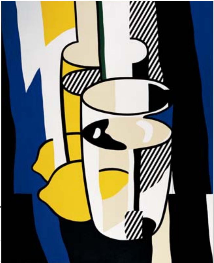
Roy Lichtenstein, Glas und Zitrone vor einem Spiegel, 1974