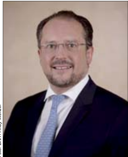
Außenminister Alexander Schallenberg

die ÖAG seit den 1990er-Jahren bei der wirtschaftlichen und politischen Zusammenarbeit mit PolitikerInnen, BotschafterInnen und Institutionen wie der Amerikanischen Handelskammer.