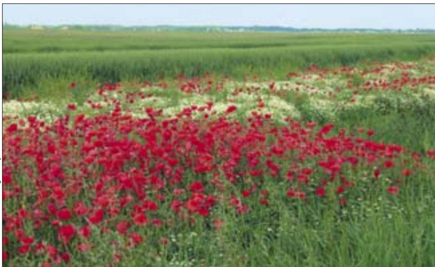
Klatschmohn im Seewinkel bei St. Andrä am Zicksee