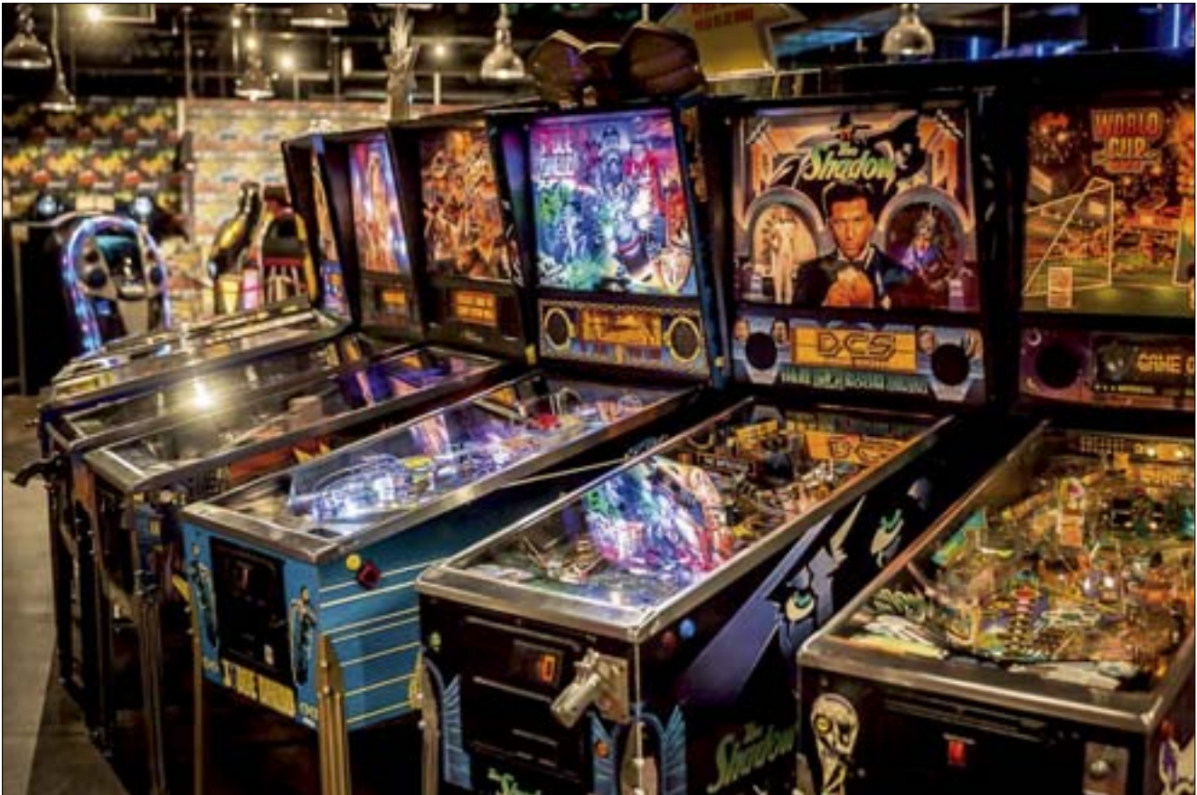
Sammler und Techniker Günter Freinberger ist stolz auf die 250 schönsten und seltensten Flipper seiner 570 Stück umfassenden Sammlung.