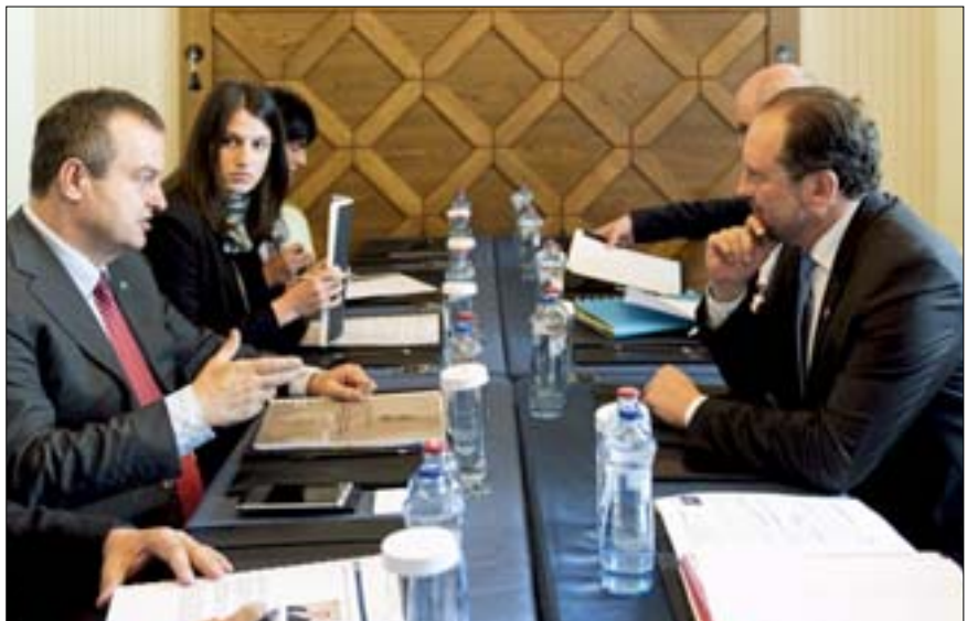
... und mit dem serbischen Außenminister Ivica Dačić (l.)