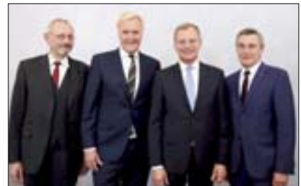
Albertina im Oö. Landesmuseum