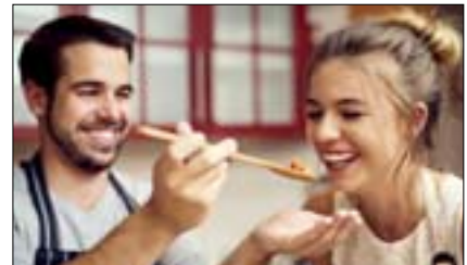
So kocht Österreich