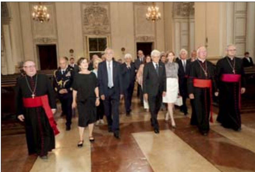
Im Dom zu Salzburg wurde – im Beisein von Erzbischof Franz Lackner – dem Staatsgast zu Ehren ein kurzes Konzert auf den zwei Orgeln der Kathedrale gegeben,

Eine Stippvisite in Mozarts Geburtshaus stand am Beginn des Spaziergangs von von Bundespräsident Alexander Van der Bellen, Landeshauptmann Wilfried Haslauer und Bürgermeister Harald Preuner durch die Altstadt, die aufgrund ihrer an italienische Vorbilder angelehnten Architektur auch als „Rom des Nordens“ bezeichnet wird. Mattarella besichtigte Mozarts Originalgeigen und trug sich in das Ehrenbuch der Internationalen Stiftung Mozarteum ein.