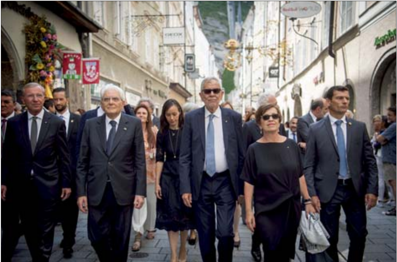
Spaziergang durch Salzburg, das „Rom des Nordens“ (v.l.): Landeshauptmann Wilfried Haslauer, Staatspräsident Sergio Mattarella, Bundespräsident Alexander Van der Bellen und seine Gattin Doris Schmidauer