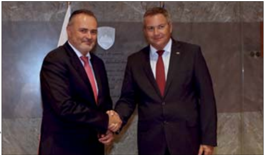
Landeshauptmann Hans Peter Doskozil traf auch Sloweniens Parlamentspräsidenten Dejan Židan zu einem Arbeitsgespräch.